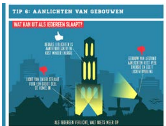
Eén van de tips van de website Sterren Dichterbij