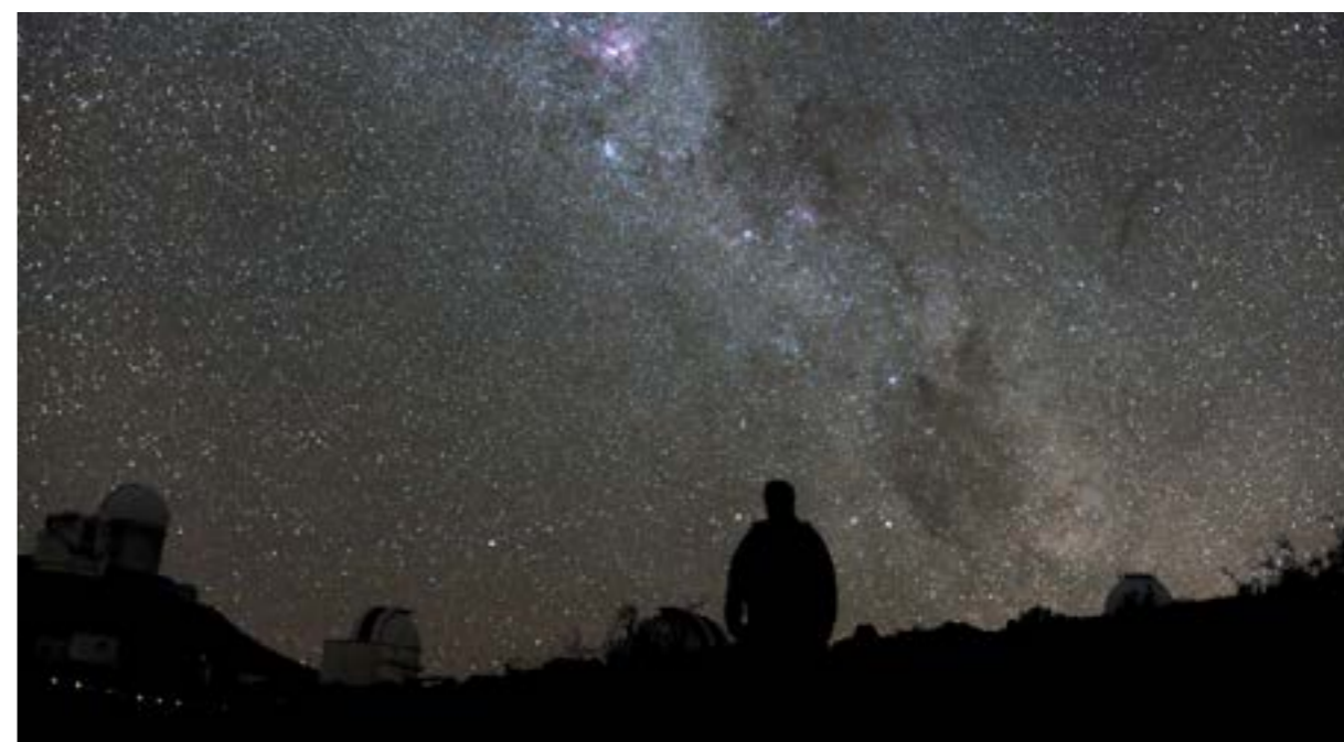
In Nederland is de Melkweg niet meer te zien door lichtvervuiling

Door de overdaad aan licht is in Nederland slechts een beperkte sterrenhemel te zien. Voldoende duisternis is een oerwaarde en heeft tevens een positief effect op de gezondheid en het welzijn van mensen en dieren. In verschillende onderzoeken zijn er relaties gelegd tussen kunstlicht en borstkanker , slaapstoornissen en stress. Uit onderzoek blijkt tevens dat veel Nederlanders lichthinder ervaren. Te denken valt aan lantaarnpalen of reclameverlichting van kantoren dicht bij slaapkamerramen. Een derde van alle mensen op aarde kan 's nachts de Melkweg niet meer zien door lichtvervuiling. Wetenschappers maakten een kaart met de gebieden waar de Melkweg niet langer zichtbaar is vanaf de aarde. Ook in Nederland is de Melkweg niet meer te zien.