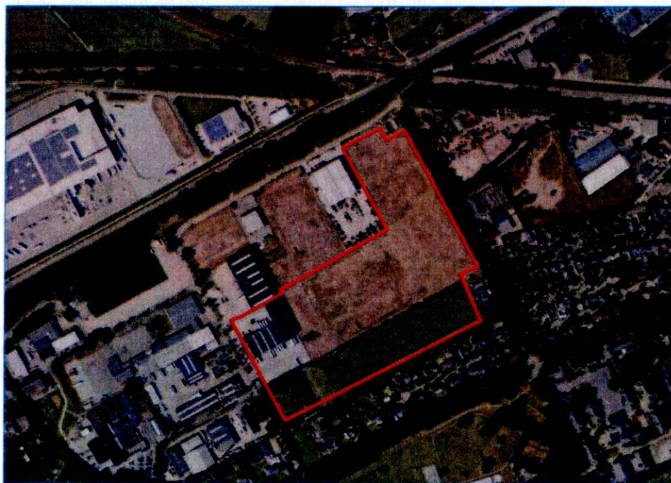
Figuur 1-1 Plangebied

Evolution RE, een ontwikkelaar in logistiek vastgoed, heeft het voornemen een nieuw distributiecentrum aan de Industriekade in Weert te realiseren. Het distributiecentrum bestaat uit maar liefst 89.100 m 2 bruto vloeroppervlak, waarvan 5.200 m 2 bruto vloeroppervlak kantoor en 83.900 m 2 bruto vloeroppervlak bedrijfshallen (zie de luchtfoto hieronder).